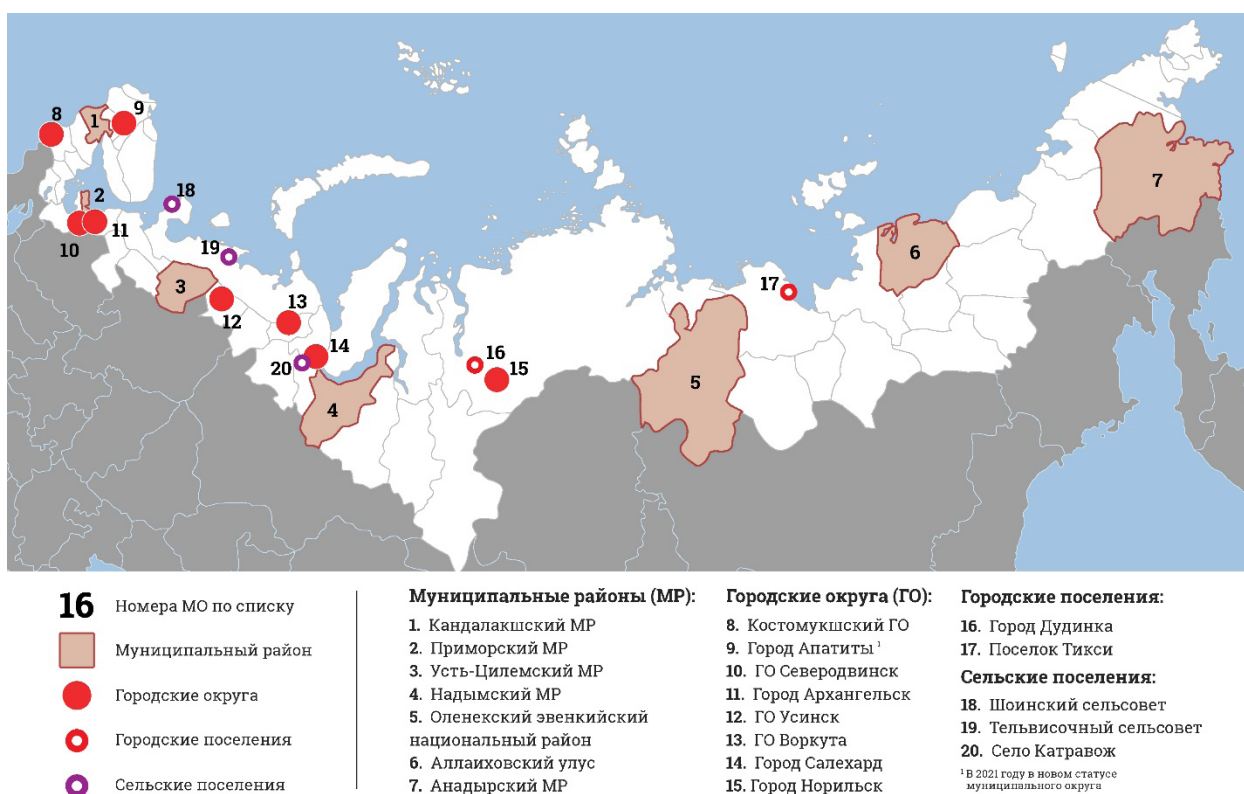
Рис. 2. Муниципальные образования, стратегии которых были проанализированы на предмет наличия арктической специфики (подготовлено автором)

вается во всех стратегиях, а 1 – ни в одной из них. Результаты представлены в табл. 2.