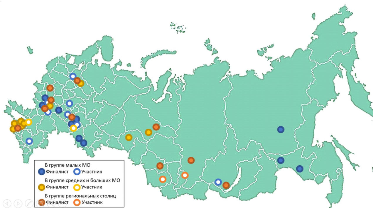
Рис. 1. География участников конкурса

Финал КМС-2023 прошел 30 октября в рамках XXI Общероссийского форума «Стратегическое планирование в регионах и городах России».